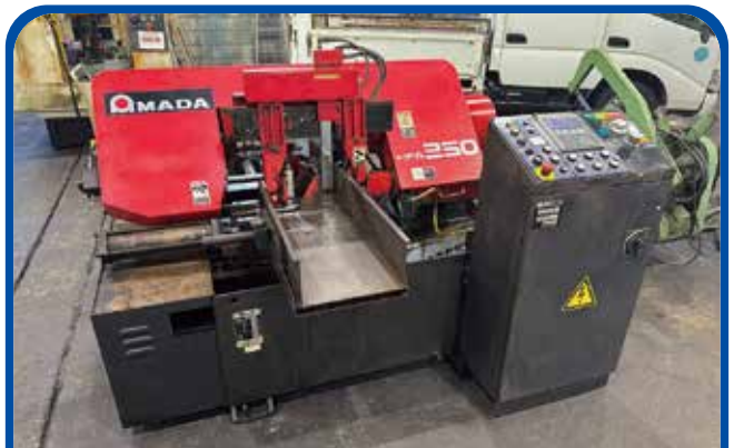
250mm全自動バンドソー (アマダ) (大阪) 2011年 HFA-250 150万円 税込165万円