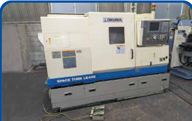
ドラム形NC旋盤(オークマ) (大阪) 2002年 LB400 180万円 制御 OSP-E100L 税込198万円