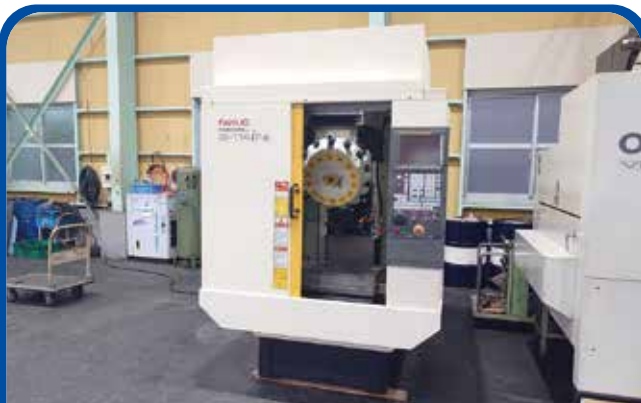
#30立形マシニングセンタ(ファナック) (名古屋) 2010年 α-T14iFa 298万円 制御 FANUC-31i-MA5 税込327.8万円