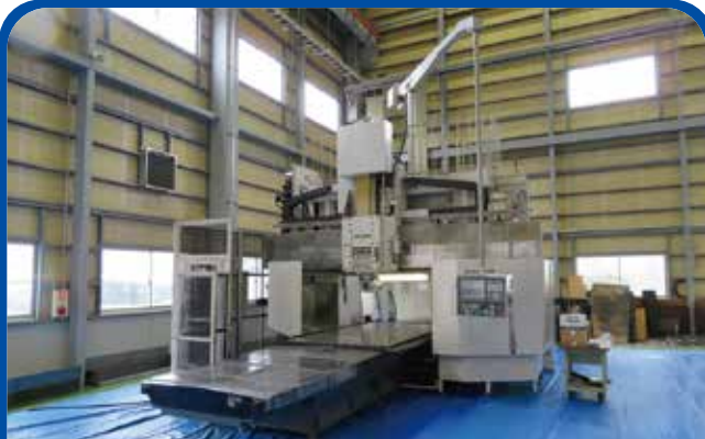
五面加工機(オークマ) (高崎) 2007年 MCR-A5C 20×30 2580万円 制御 OSP-P200M 税込2838万円