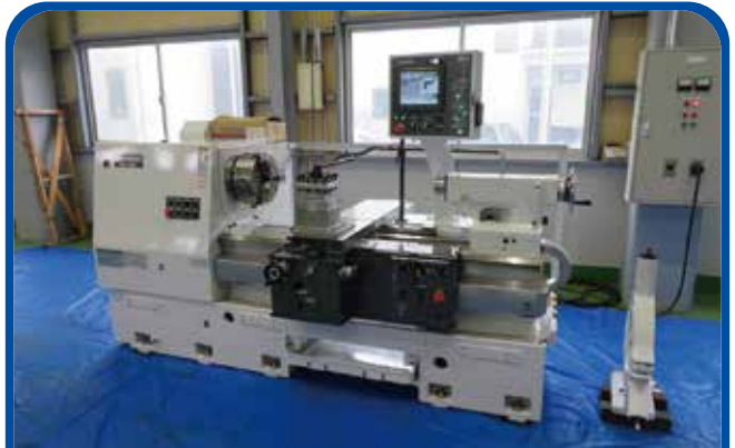
フラット形NC旋盤(滝澤鉄工所) (高崎) 2022年 TAC650L10 780万円 制御 FANUC-Oi-TF 税込858万円