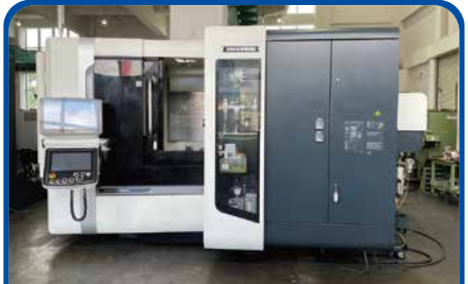
#40横形マシニングセンタ(DMG森精機) (足立) 2015年 NHX4000 1280万円 制御 M730UM(CELOS) 税込1408万円